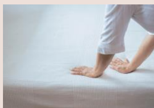
ホテルメソッドのベッドメイクも承ります。