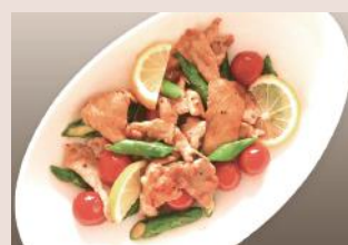
盛り付けは彩りよく、季節感も大切に。

お客様のご要望に真摯に耳を傾けて、お掃除・お料理だけでなく 本当にお役に立てる家事代行サービスをお届けいたします。