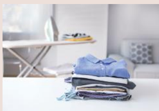
お洗濯物はきちんと畳んで収納まで。