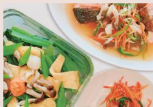
一汁三菜を基本に、お野菜たっぷりの家庭料理。